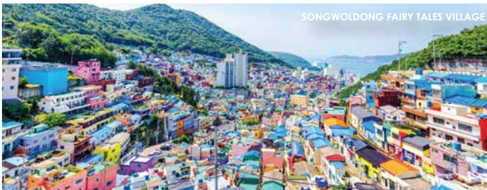
SONGWOLDONG FAIRY TALES VILLAGE

Tiba di Lapangan Terbang Antarabangsa Kuala Lumpur