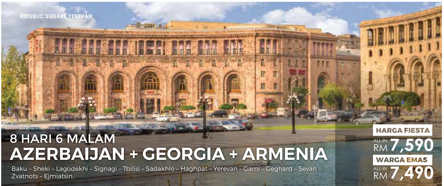
REPUBLIC SQUARE YEREVAN